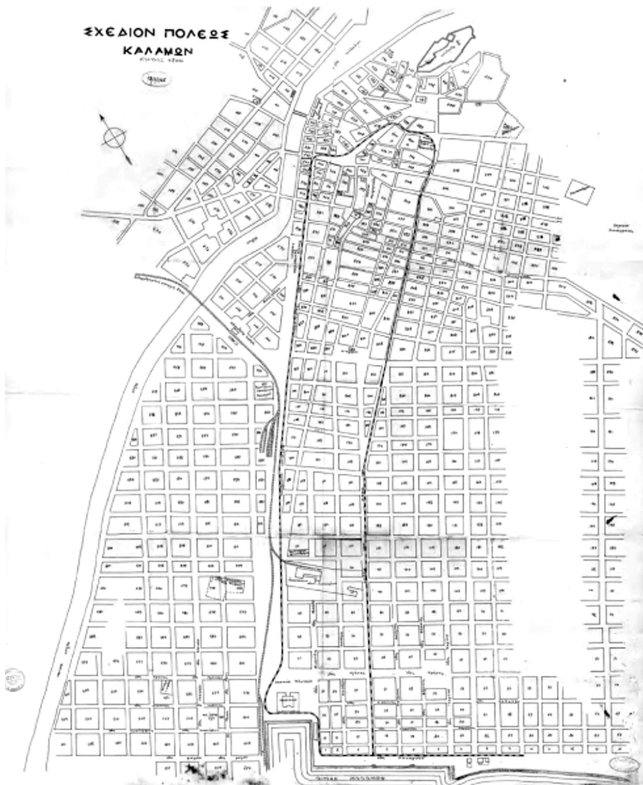
Το σχέδιο του 1905 προέβλεπε μια τεράστια πλατεία από τη σημερινή βόρεια πλευρά της μέχρι και το λιμάνι