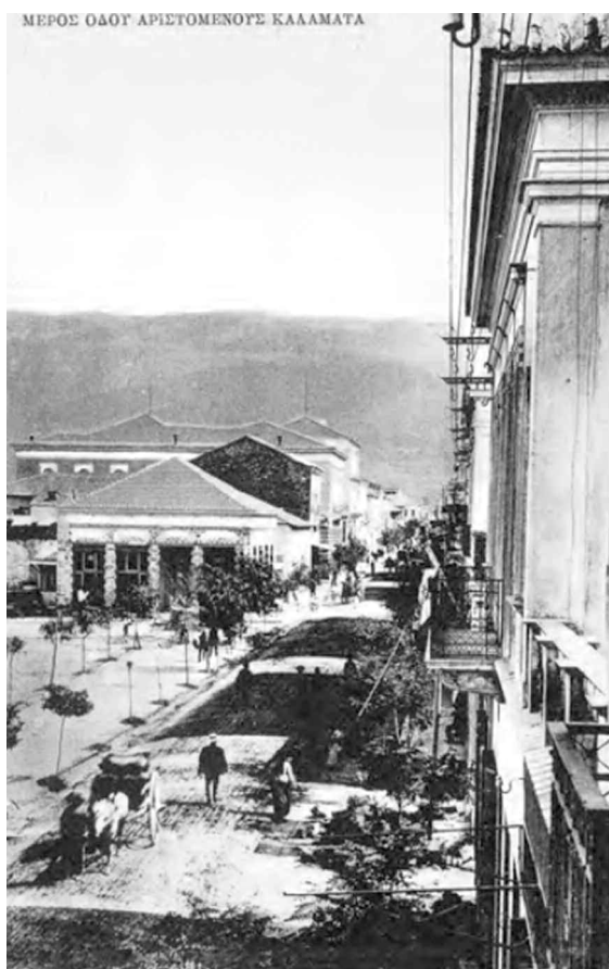
ΜΕΡΟΣ ΘΑΟΥΤ ΑΡΙΣΤΟΜΕΝΟΥΣ ΚΑΛΑΜΑΤΑ