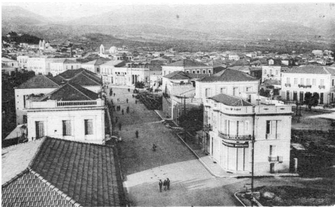
ΚΑΛΑΜΑΤΑ: ΚΕΝΤΡΙΚΗ ΑΠΟΨΙΣ