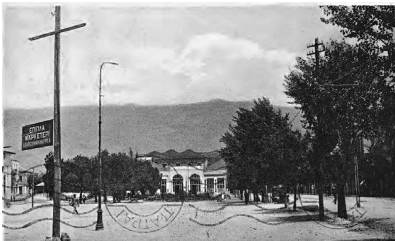
ΚΑΛΑΜΑΙ — Πλατεία Τζαννί.