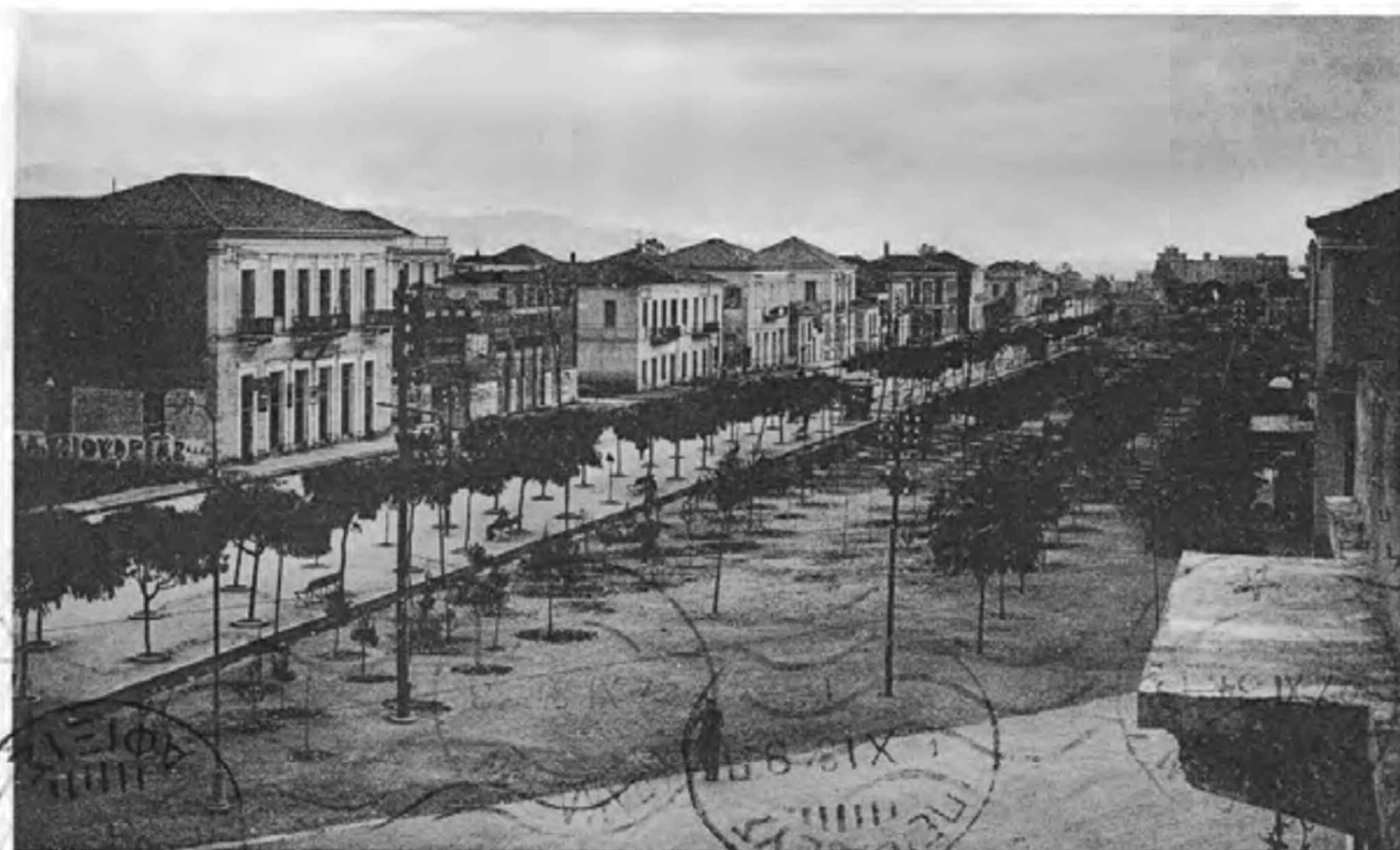
Καλάμα, 'Οδός 'Αριστομένουσ'