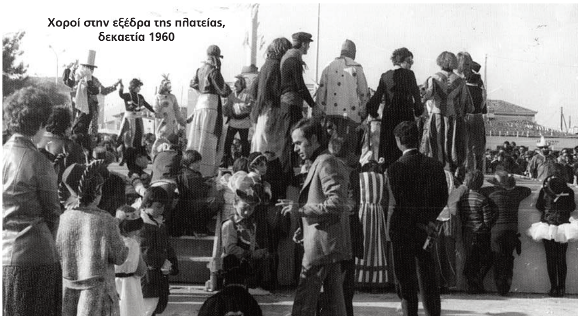
Χοροί στην εξέδρα της πλατείας, δεκαετία 1960

Καρλσρούης" (μικτόν εκ Δυτικής Γερμανίας, απαρτιζόμενον εκ 62 καλλιτεχνών).