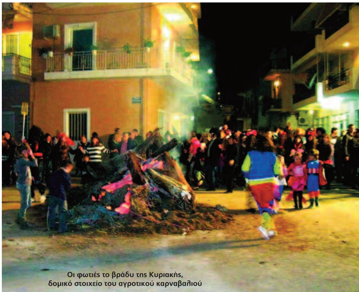
Οι φωτιές το βράδυ της Κυριακής, δομικό στοιχείο του αγροτικού καρναβαλιού

Πόθη Λουκάκου στα "Νέα" της Καθαμάτας στις 5 Μαρτίου όπου καλούνται οι Μεσσήνιοι την Κυριακή το βράδυ στις Νησιώτικες ρούγες για να χορέψουν "υποχρεωτικώς γύρω από τη μεγάλη φωτιά κάθε ρούγας βοηθούμενοι από τον γλυκύ ρυθμό της πίπιζας και του νταουλιού". Από εκεί και ύστερα οι φωτιές έγιναν οργανικό στοιχείο του αστικού πλέον καρναβαλιού παίρνοντας και διαγωνιστικό χαρακτήρα, το έθιμο έγινε θέαμα και σταδιακά απονεκρώθηκε βοηθούσης και της βαθιάς αλλαγής στις κοινωνικές συνθήκες που είχε ως συνέπεια τη διάλυση της "κοινότητας" στο χώρο της γειτονιάς.