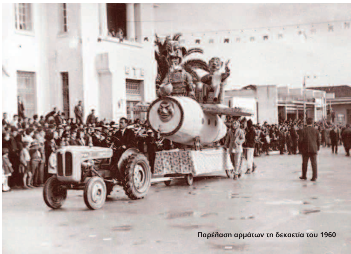
Παρέλαση αρμάτων τη δεκαετία του 1960