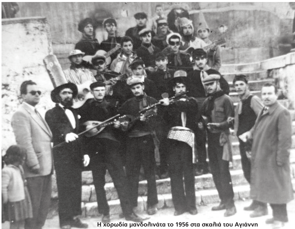
Η χορωδία μανδοлинάτα το 1956 στα σκαλιά του Αγιάωνν

πλήρης κατανόηση του ιερού σκοπού για τον οποίο εδίδετο η χοροεσπερίς, ευχάριστον δηλαδή φαινόμενον, το οποίο φανερώνει πως ο πολιτισμένος κόσμος επικροτεί κάτι το ευγενές, κάτι το απαραίτητον που πρέπει να γίνη στον τόπον του. Εκείνο δε εν ολίγοις που διεπίστωσα το προχθεσινό βράδυ, είναι η υλική και ηθική προθύμως συμπαραστάσις των κατοίκων του Νησιού δίπλα από τους δημιουργούς της προχθεσινής βραδυάς αγαπημένους μας εκπαιδευτικούς. Να γιατί πρόθυμα τα καταστήματα της πόλεως που αν και διανύουν την κρισιμωτέραν ανεργίαν προσέφεραν πρόθυμα διάφορα εκλεκτά δώρα τα οποία διά κληρωτίδος εδόθησαν στους τυχερούς της βραδυάς.