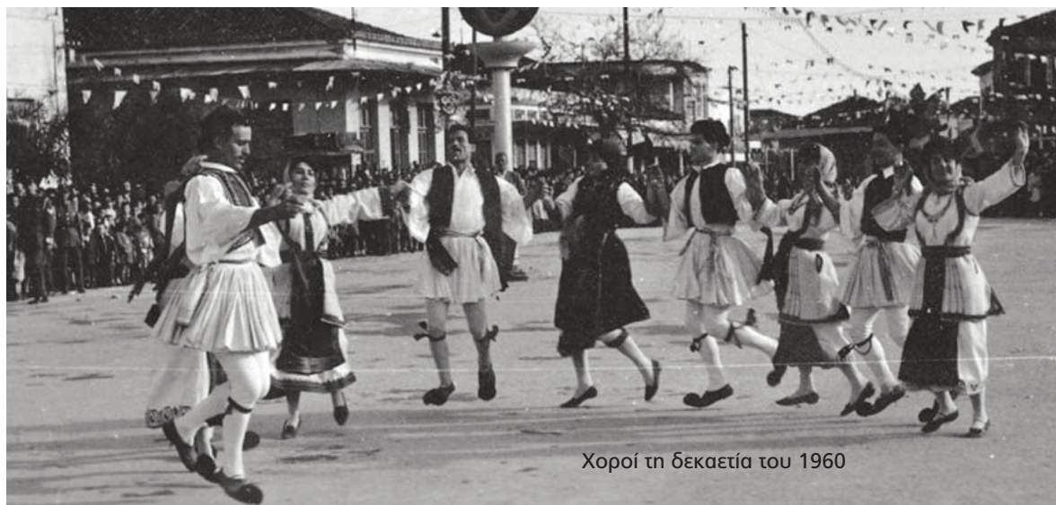
Χοροί τη δεκαετία του 1960

Για το 1924 δεν έχουν δημοσιευτεί πληροφορίες ωστόσο το καρναβάλι συνεχίζεται και εισάγονται σε αυτό νέα στοιχεία, αηλιά οι αποκριάτικες εκδηλώσεις "προικίζονται" με απαγορεύσεις που επιχειρούν να αηλιοιώσουν το χαρακτήρα τους και να θέσουν υπό έλεγχο τη σάτιρα και να της αφαιρέσουν τα λαϊκά στοιχεία και τον πολιτικό της χαρακτήρα. Έτσι για το 1925 διαβάζουμε στη "Σημαία" (87) ότι απαγορεύεται ακόμη και το... μασκάρωμα: "Η Διοίκησης Χωροφυλακής Μεσσηνίας υπέβαλεν εις την Νομαρχίαν προς έγκρισιν διάταξιν διά της οποίας απαγορεύεται η χρήση προσωπίδων καλυπτουσών ολόκληρον το πρόσωπον καθώς και πάσα παραμόρφωσις του προσώπου. Επίσης απαγορεύονται τα άσεμνα και αηδή θεάματα και αι θίγουσαι τα δημόσια ήθη εκφράσεις και παραστάσεις. Ωσαύτως απαγορεύεται η χρήση κομφετί. Ομοίως η διακωμώδησις πολιτικών προσώπων ημετέρων ή ξένων. Υποχρεούνται δε οι ενοικιασταί ντομίνων να αποηλυμάνωσι ταύτα εφ' άπαξ".