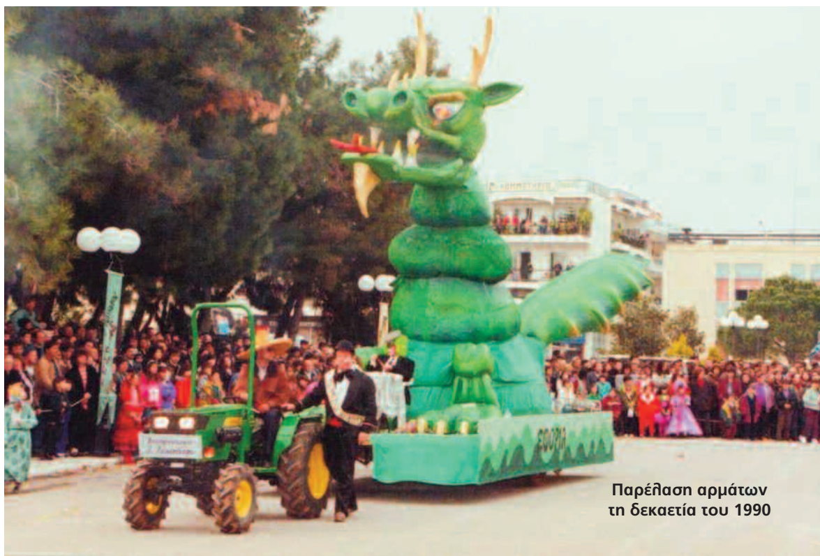
Παρέλαση αρμάτων τη δεκαετία του 1990

της πόλης θα γεμίσουν με φωτιές γύρω από τις οποίες θα υπάρχουν μεταμφιεσμένοι, μεζέδες, κρασί, χορός και διασκέδαση μέχρι το πρωί.