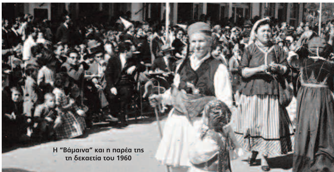
Η "Βάμαινα" και η παρέα της τη δεκαετία του 1960

Την 4η Αυγούστου 1936 επιβάλλεται η δικτατορία του Μεταξά. Το καθεστώς κάνει ό,τι είναι δυνατόν για την πραγματοποίηση εντυπωσιακών εκδηλώσεων για λόγους προπαγανδιστικούς. Χαρακτηριστικό των φασιστικών καθεστώτων σε όλες τις εποχές και δεν θα μπορούσε να χαθεί η ευκαιρία εκμετάλλευσης μιας εκδήλωσης βαθιά ριζωμένης στη λαϊκή συνείδηση, όπως το Νησιώτικο καρναβάλι.