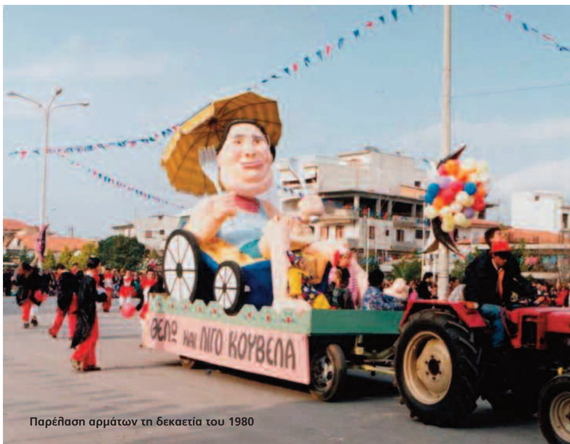
Παρέλαση αρμάτων τη δεκαετία του 1980