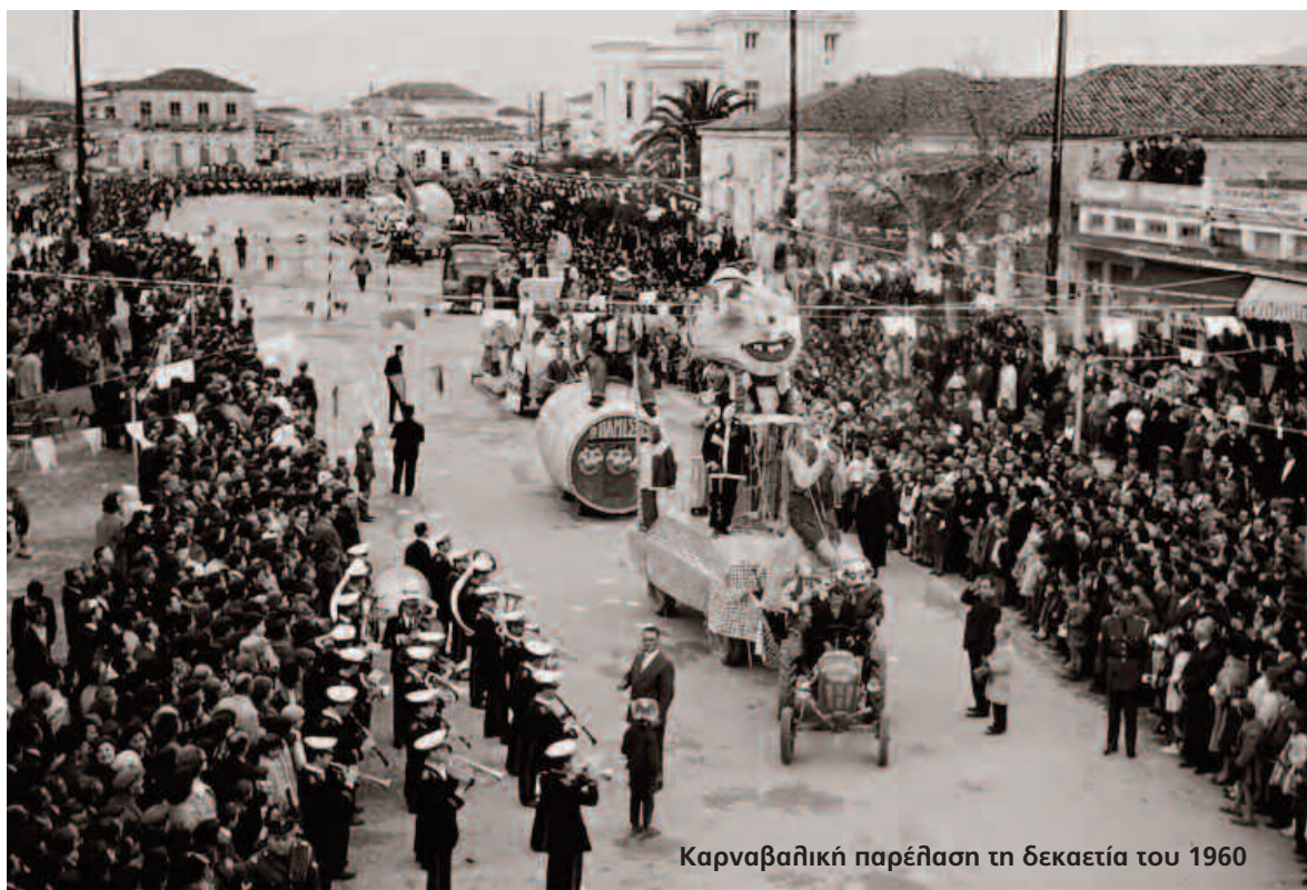
Καρναβαλική παρέλαση τη δεκαετία του 1960

Αξίζει να σημειωθεί μάλιστα ότι πολλά στοιχεία της Αποκριάς στα Βαλκάνια «προέρχονται από τις διαπομπεύσεις στο βυζαντινό ιππόδρομο: το μουντζούρωμα, η γαϊδουροκαβάλα με ίππευση ανάποδα πάνω σε ζώο ή "καμήλα", το κρέμασμα κουδουνιών, η μεταμφίεση σε γυναίκα, η ένδυση σε κουρέλια, το πασάλλειμμα με στάχτη, πίσσα και άλλα, αισχρολογίες και παντομιμικά υπονοούμενα, όλα αυτά ήταν ατιμωτικές πράξεις εις βάρος του καταδικασμένου που τον γύριζαν, πριν την τιμωρία του, στον ιππόδρομο.