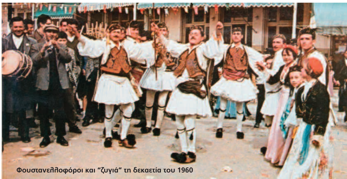
Φουσανελληφορόροι και "ζυγιά" τη δεκαετία του 1960

Αναλυτικά στο ρεπορτάζ της εφημερίδας αναφέρονται τα εξής: «Ο,τι και να κάμωμεν οι Καλαματιανοί, δεν μπορούμε να φθάσωμεν τους Νησιώτας. Εμείς εδώ κάμνομεν τον σοβαρόν και κινούμεθα μόνον από... συνήθειαν. Δεν ξεύρωμεν ούτε να ζήσωμεν, ούτε να χαρώμεν, ούτε να ευθυμήσωμεν, ούτε να διασκεδάσωμεν. Εδώ υπάρχουν ταηλαράδες, εκεί υπάρχουν φουκαράδες. Αλλ' οι δικοί μας ζουν εις μίαν ατμόσφαιραν σοβαροτάτη και μελαγχολικήν, ενώ οι Νησιώτες μέσα στη φτώχεια τους ξέρουν να χαρούν και να διασκεδάσουν. Την αλήθειαν ταύτην απέδειξεν η Καθαρά Δευτέρα. Οσοι είχαν την έμπνευσιν να επισκεφθούν την γείτονα πόλιν, αντελήφθησαν ότι οι Νησιώτες διασκεδάζουν στ' αλήθεια.