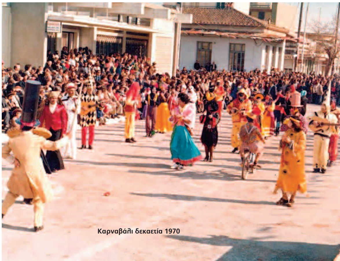
Καρναβάλι δεκαετία 1970