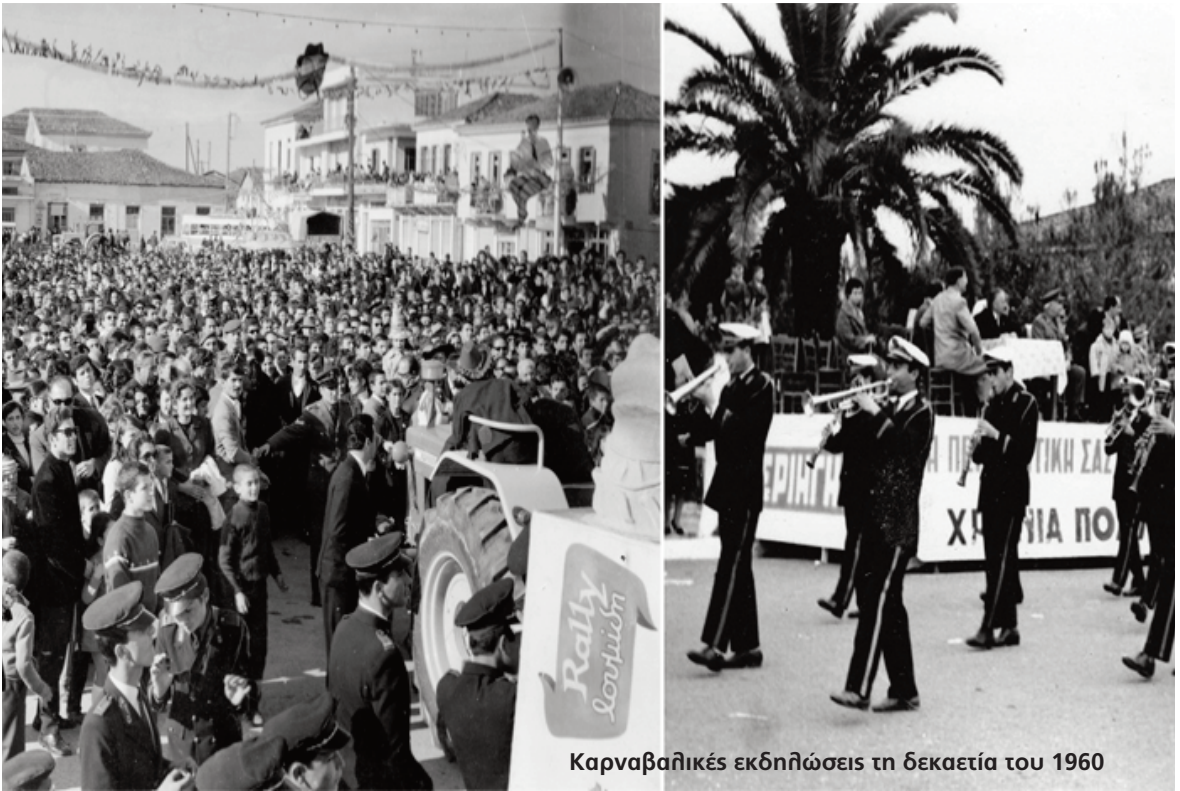
Καρναβαλικές εκδηλώσεις τη δεκαετία του 1960

Την 12ην μεσημβρινήν ο Καρνάβαλος θα... εκφωνήση τον καθιερωμένον αποκρηάτικον λόγον του. Εφέτος ο λόγος θα χαρακτηρίζεται από χιούμορ και αθών "πείραγμα" καταστάσεων και γεγονότων. Την 3ην μ.μ. θα εμφανισθή το "κλήυ" του εορτασμού. Το περίφημον συγκρότημα Κουσιάδη θα χορεύση ελληνικούς χορούς. Την 4ην μ.μ. θα γίνη η μεγάλη παρέλασις του Καρναβάλλου ενώπιον της επιτροπής η οποία θα βραβεύση τας καλύτερας μεταμφιέσεις. Θα προπορευέται η Φιλαρμονική, θα ακολουθούν δε τα άρματα, ομάδες ντομινοφόρων, φουστανελλοφόρων, Αμαλιών και ομάδων αι οποίαι θα παρωδούν διάφορα επίκαιρα θέματα και καταστάσεις. Μετά την λήξιν των παρελάσεων το συγκρότημα Κουσιάδη θα παρουσιάση και πάλι εθνικούς χορούς. Καθ' όλην την ημέραν θα λειτουργεί η ιστορική Νησιώτικη "Κρεμάλλα" και την εσπέραν εις την κεντρικήν πλατείαν της Μεσσήνης θα καούν φαντασμαγορικά πυροτεχνήματα".