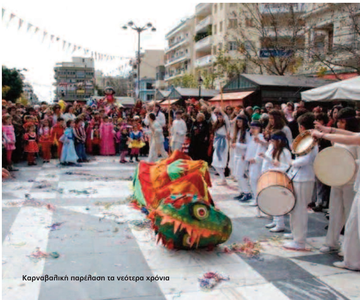
Καρναβαλική παρέλαση τα νεότερα χρόνια

μόρφωσης. Η αγάπη και η αφοσίωση των ανθρώπων που τον μύησαν στην τέχνη τον έκανε και αυτόν γνήσιο καρναβαλιστή. Το συνεργείο του τους τελευταίους δύο μήνες έχει σταματήσει κάθε δραστηριότητα που να αφορά το δήμο, έχει πάρει ο καθένας τους από ένα πινέλο και βάφουν τα άρματα. Η φροντίδα δεν σταματά στο βάψιμο. Γίνονται και άλλες μετατροπές ώστε να φαντάζει σαν να είναι φτιαγμένο από την αρχή. "Αλλιάζουμε ένα κεφάλι, κρατάμε το σώμα και αλλιάζουμε όλο το θέμα", εξηγεί. Η έμπνευση για τα θέματα έρχεται από την επικαιρότητα, αλλήλωσε το καρναβάλι της Μεσσήνης διακρίνεται για την πολιτική του σάτιρα. "Φέτος επειδή είναι στην επικαιρότητα το θέμα με το Ζαχόπουλο θα σας αποκαλύψω ότι θα βγάλουμε την "Ζαχοπουλιάδα" και τώρα που προέκυψε το Σκοπιανό και η κ. Ντόρα κάνει όλες τις ζυμώσεις την καρναβαλεύουμε και αυτήν. Αυτές τις μέρες φτιάχνουμε άρμα αφιερωμένο στις 5 ονομασίες του Νίμιτς. Δεν έχουμε καταλήξει στο τίτλο αλλιά μάλλον θα το ονομάσουμε "Σκό-ρ-πια Μακεδονία".