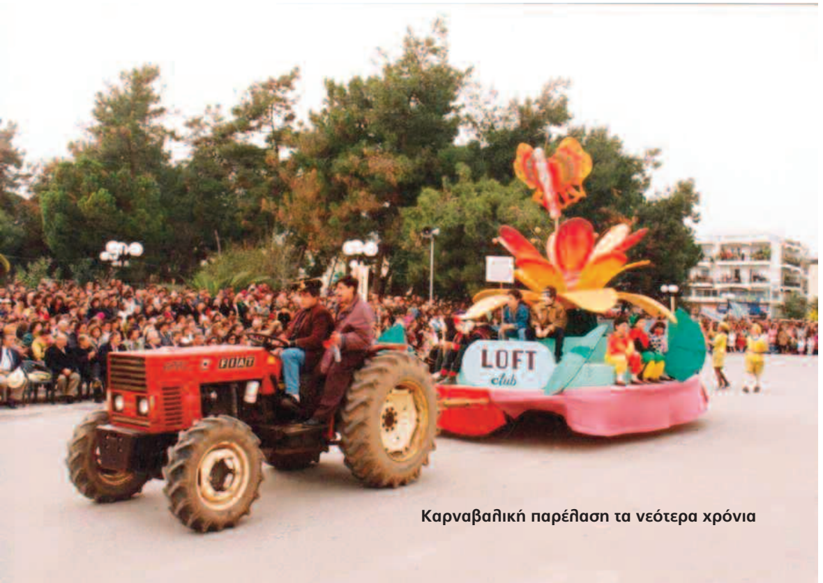
Καρναβαθική παρέλση τα νεότερα χρόνια

χογείας ντυμένα πειρατές. Παιδιά από το Νηπιαγωγείο και το Δημοτικό Σχολείο Χαρακοπιού μαζί με το Δημοτικό Κορώνης, που χόρεψαν το "Γκούτσι φόρεμα" και έστειλαν το μήνυμα "Φόρεμα Γκούτσι και μυαλό κουκούτσι". Μαθητές από τα Δημοτικά Αβραμιού και Λευκοχώρας που παρουσίασαν το αποκριάτικο πάρτι. Παιδιά από τα Δημοτικά Καρτερολήιου και Σταυροπηγίου ντυμένα σκιάχτρα. Μαθητές από το 1ο Δημοτικό Μεσσήνης που με το ντύσιμό τους, παρουσίασαν την άνοιξη, ενώ δεν έλειψαν και άλλες ξεχωριστές φορεσιές. Το Κέντρο Ξένων Γλωσσών "Αγγουρά", με κορίτσια που φορούσαν τις παλιές μπλε σχολικές ποδιές και με άλλα αποκριάτικα θέματα. Παιδιά από το 3ο Δημοτικό Μεσσήνης, ντυμένα παλιάτσκι και ψαράδες. Μαθητές από το Δημοτικό Εύας, που παρουσίασαν τη φάρσα κέρρασμα και παιδιά από τα 2ο και 4ο Δημοτικά Σχολεία Μεσσήνης, με θέμα φρούτα και πουλιά.