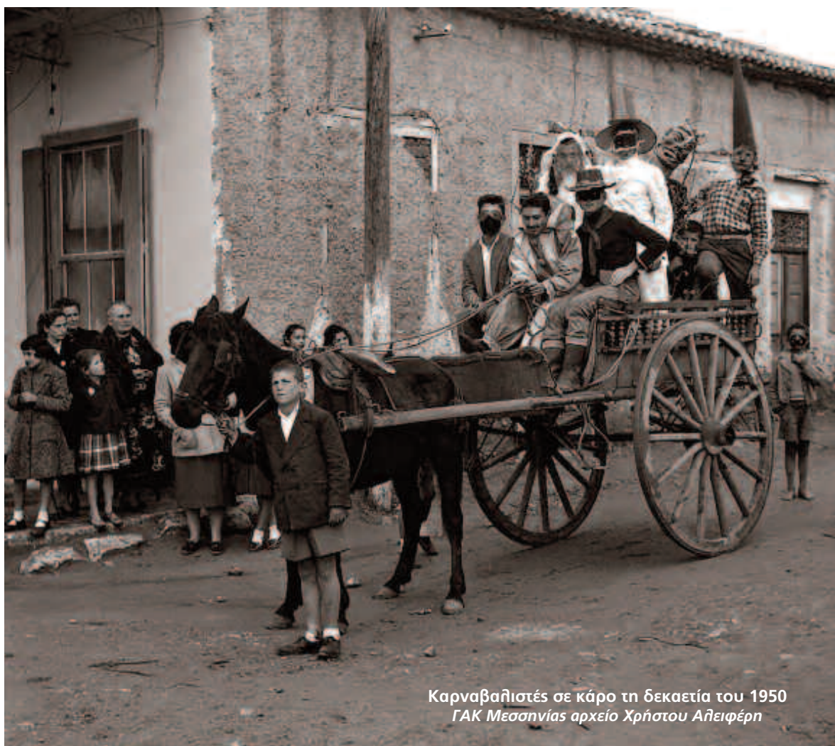
Καρναβαλιστές σε κάρτο τη δεκαετία του 1950