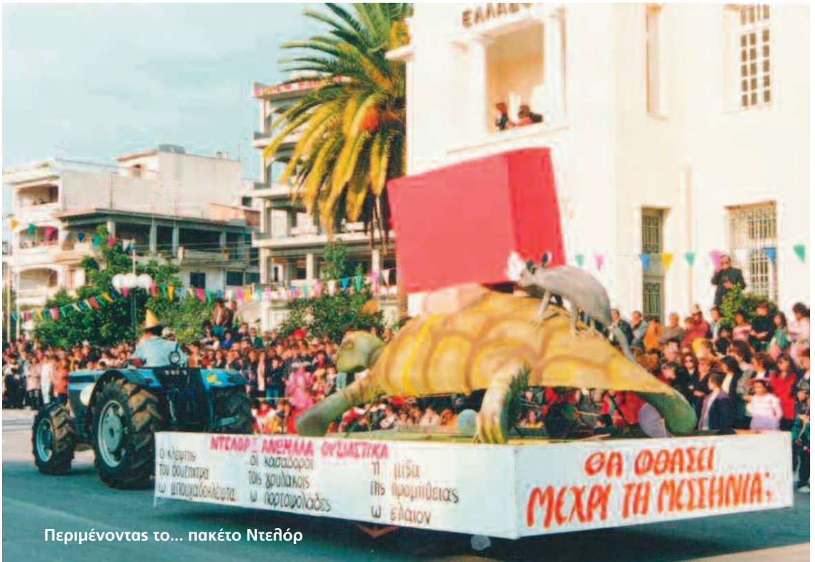
Περιμένοντας το... πακέτο Ντελέρ