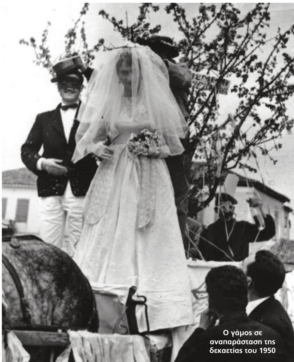
Ο γάμος σε αναπαράσταση της δεκαετίας του 1950