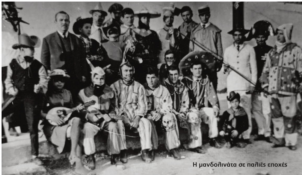
Η μανδολινάτα σε παλιές εποχές