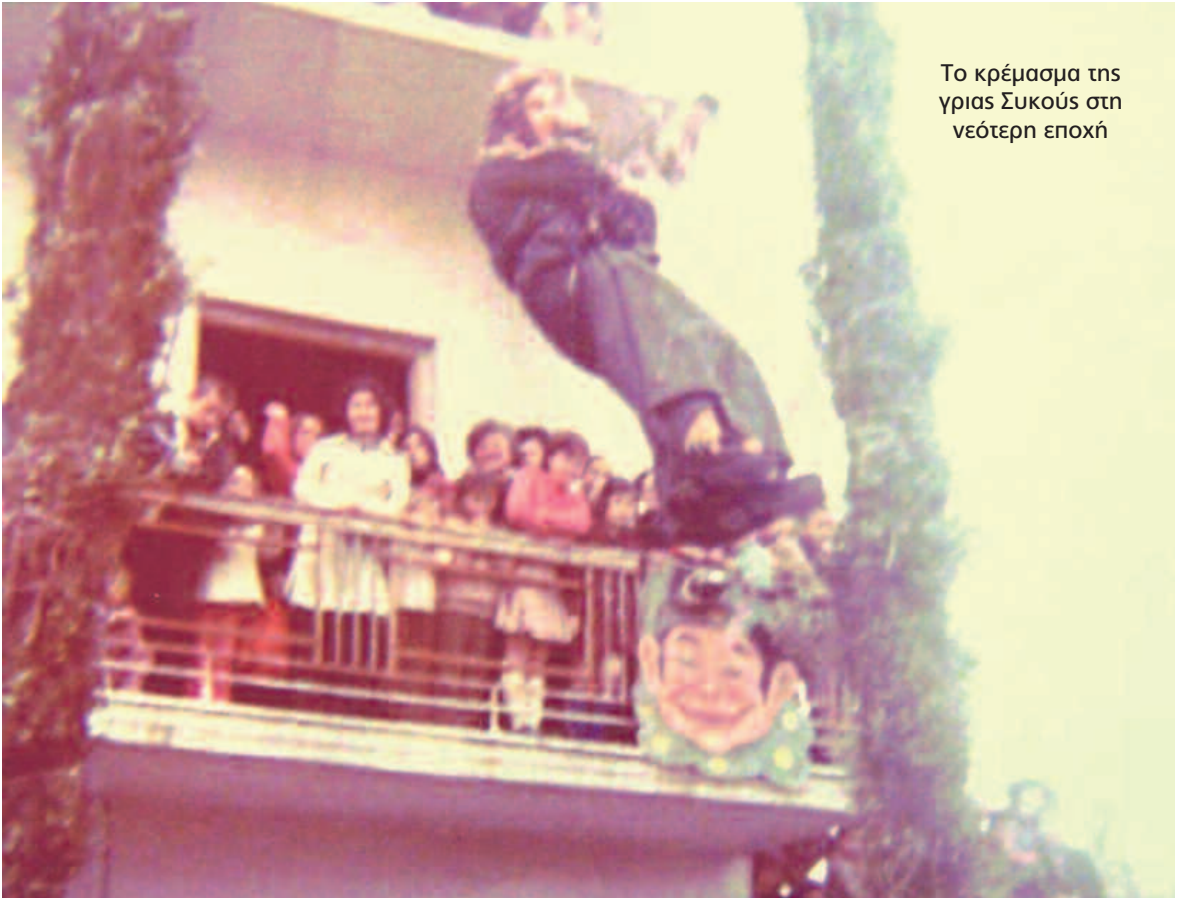
Το κρέμασμα της γριας Συκούς στη νεότερη εποχή