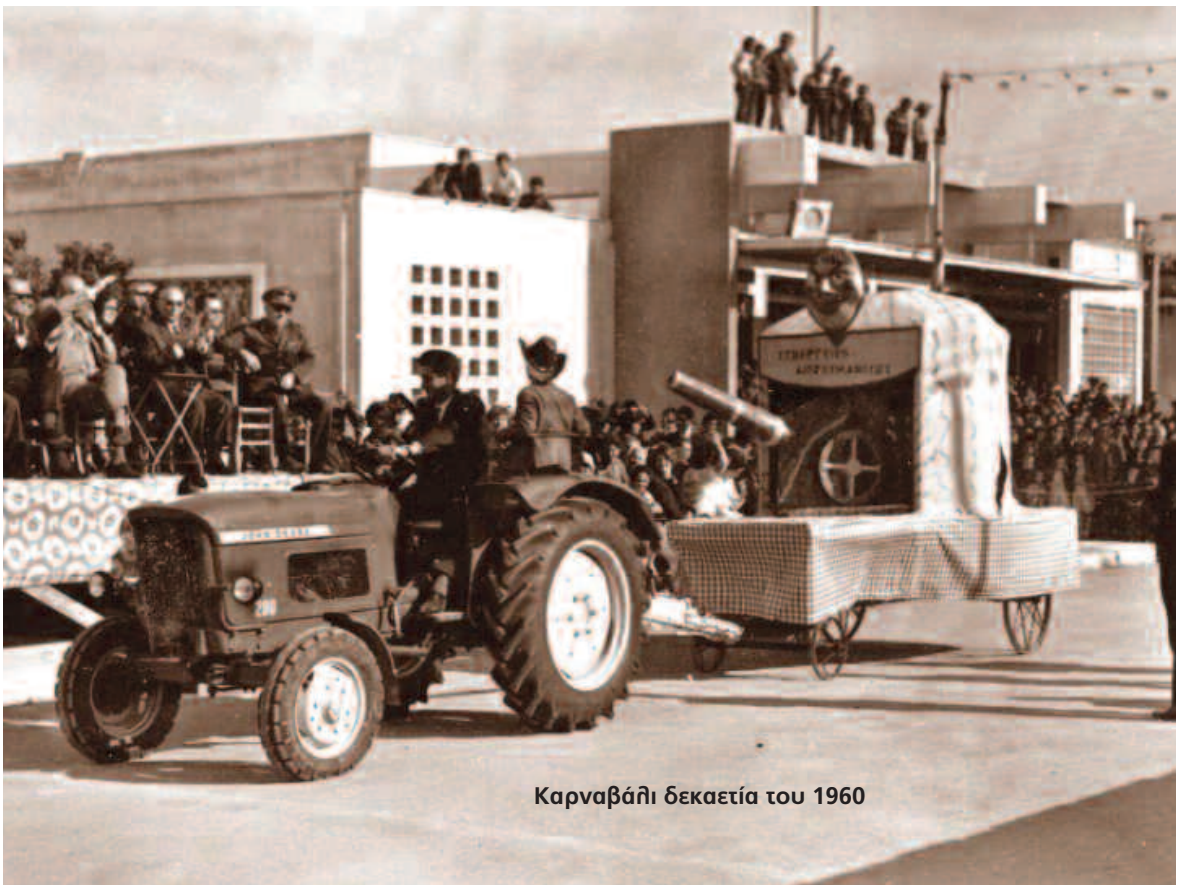
Καρναβάλι δεκαετία του 1960