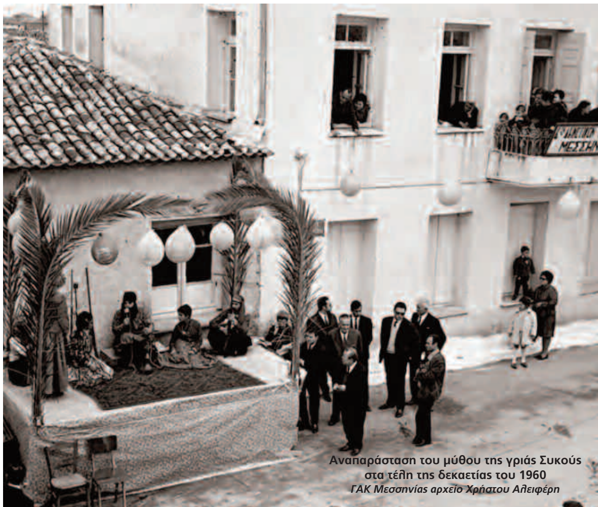
Αναπαράσταση του μύθου της γριάς Συκούς στα τέλη της δεκαετίας του 1960 ΓΑΚ Μεσσηνίας αρχείο Χρήστου Αλειφέρη

Η απαγόρευση έχει ως εξής: "Εκ της Διοικήσεως Χωρ/κνης Μεσσηνίας εξεδόθη η κάτωθι ανακοίνωσις: Ανακοινούμεν ότι δυνάμει της υπ' αριθ. 31/48 από 8.2.55 διαταγής του Υπουργείου Εσωτερικών και της υπ' αριθ. 8/39 Αστυνομικής ημών Διατάξεως, κατά την περίοδο των εορτών των Αποκρέω απαγορεύεται απολύτως η χρησιμοποίησις προσωπίδων καλυπτουσών εξ ολοκλήρου το πρόσωπον και η μεταμφίσεις ατόμων κατά τρόπον καθιστώντα αυτά αγνώριστα.