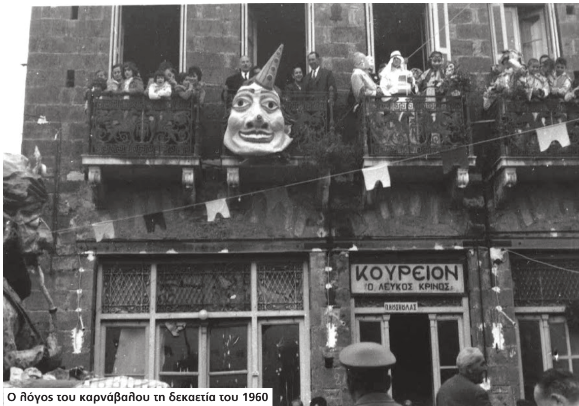
Ο λόγος του καρνάβαλου τη δεκαετία του 1960

Το 1938 αναγγέλλεται "μεγαλοπρεπής" γιορτασμός της Καθαράς Δευτέρας (128) : "Τα κούλουμα εις την γείτονα Μεσσήνην θα εορτασθούν και εφέτος μεγαλοπρεπώς. Η οργανωτική επιτροπή της εορτής της Καθαράς Δευτέρας προεκήρυξε ήδη διάφορα χρηματικά βραβεία τα οποία θα δοθούν εις τας καλύτερας ομάδας μετεμφιεσμένων που θα σκορπίσουν εις τους επισκέπτας την ευθυμίαν και το κέφι.