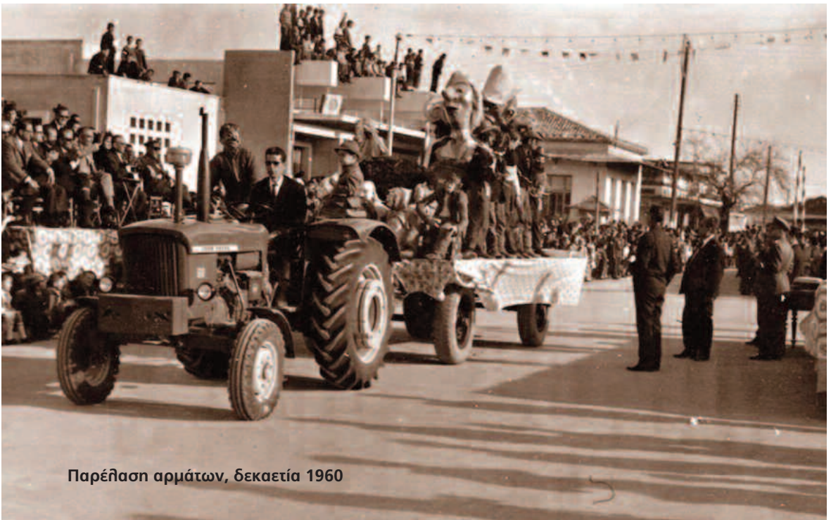
Παρέλαση αρμάτων, δεκαετία 1960

Οι πληροφορίες είναι καθημερινές (264) : "Το πρόγραμμα των αποκριάτικων εκδηλώσεων εις την Μεσσήνην κατά το διήμερον της Κυριακής και της Καθαράς Δευτέρας, περιλαμβάνει, την πρώτην ημέραν παρέλασιν ανά τας οδούς της γείτονος και χορούς και την Καθαροδευτέραν παρέλασιν του Καρναβάλιου πλαισιουμένου από άρματα, φουστανελλοφόρους, Αμα-