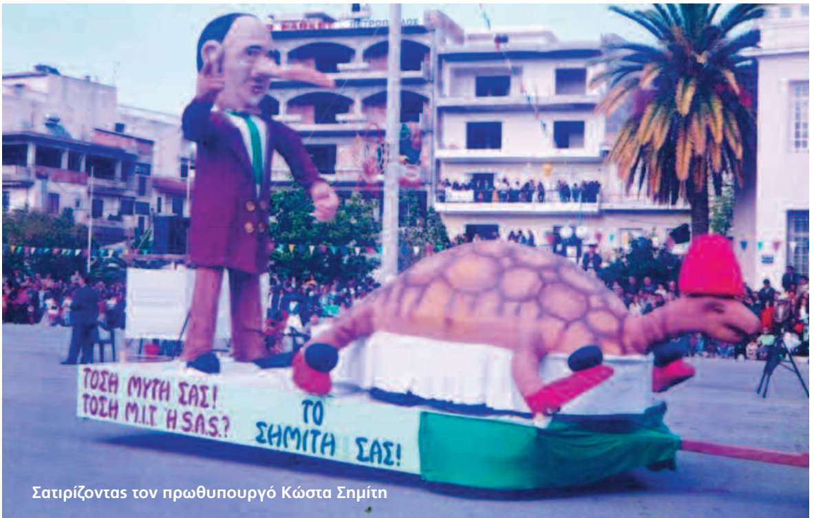
Σατιρίζοντας τον πρωθυπουργό Κώστα Σημίτη

της κάθε γειτονιάς, τα περισσότερα στολίδια είναι χορηγίας κάποιων καταστημάτων. Σε όλες τις κοιλώνες της ΔΕΗ υπάρχουν αναρτημένες ξύλινες πινακίδες με αποκριάτικες ζωγραφιές, οι οποίες στο κάτω μέρος τους αναγράφουν το όνομα κάποιου καταστήματος.