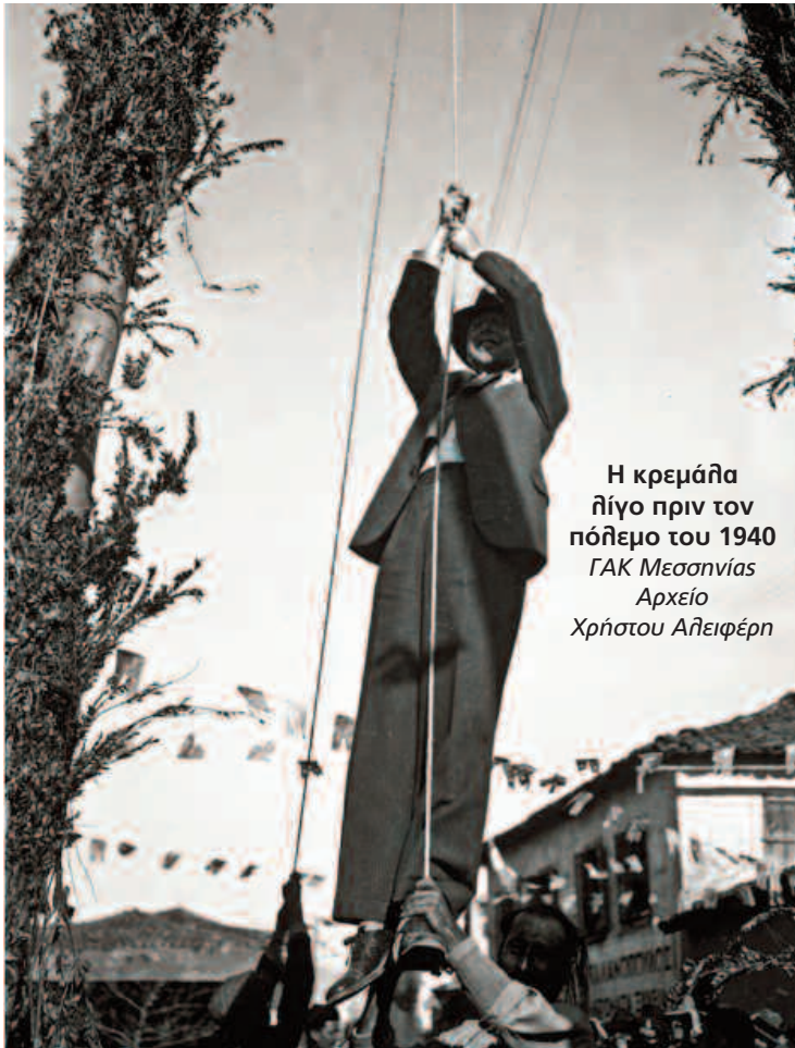
Η κρεμάλα λίγο πριν τον πόλεμο του 1940

«Του νέου τούτου Αττίλα εγκαταστάντος εν Μεσσήνη το διοικητήριον υψούτο εκεί όπου σήμερον η πρώτη των αρρένων σχολή, ανεγερθείσα επί των ερειπίων εκείνου. Εκείθεν ορμώμενος Ἰοιπὸν (ἔστιν ὅτε και εκ της Μεθώνης) επεχείρει τας εκδρομάς του εκείνας τας υπό των μεταγενεστέρων χαρακτηριζομένας ως πράξεις παντός απαίσιου και κακούργου ὄπερ ο κόσμος εγέννησε ... επιστρέφων εις Μεσσήνην εκ της μετ' ανηκούστου βιαιότητος πυρποληθείσης Τριπόλεως υπ' αυτού εν τη ακμή του αγώνος προσεβλήθη καθ' οδόν υπό πυρετού κακοήθους.