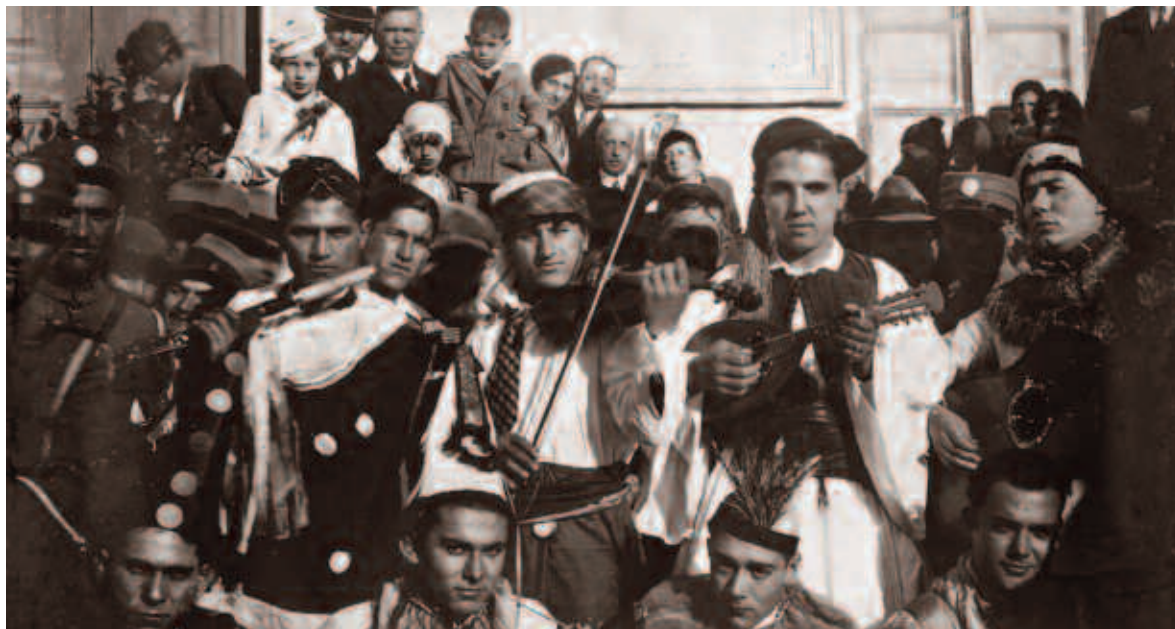
Καθαματιανοί καρναβαλιστές μπροστά από το Α' Δημοτικό Σχολείο (μετέπειτα ΑΤΕ) τη δεκαετία του 1930

που επισημαίνουμε είναι πως υπάρχει "κομιτάτο" δηλαδή επιτροπή που το οργανώνει και φροντίζει για την παρέλαση και για τη βράβευση αρμάτων και ομάδων. Το δεύτερο ότι για τις ανάγκες των εκδηλώσεων... μεταφυτεύτηκαν δέντρα για να θυμίζει ο χώρος "εξοχή". Και το τρίτο περισσότερο σημαντικό από τα άλλα είναι ότι στο καρναβάλι εμφανίζονται μεταμφιέσεις πνευματώδεις, βαθιά πολιτικές και ρηξικέλευθες για την εποχή. Πίσω από αυτές είναι άνθρωποι που γνωρίζουν καλά τα πράγματα, σχολιάζουν εξαιρετικά επίκαιρα θέματα, σατιρίζουν την κοινωνική κατάσταση και όψεις της ιστορίας.