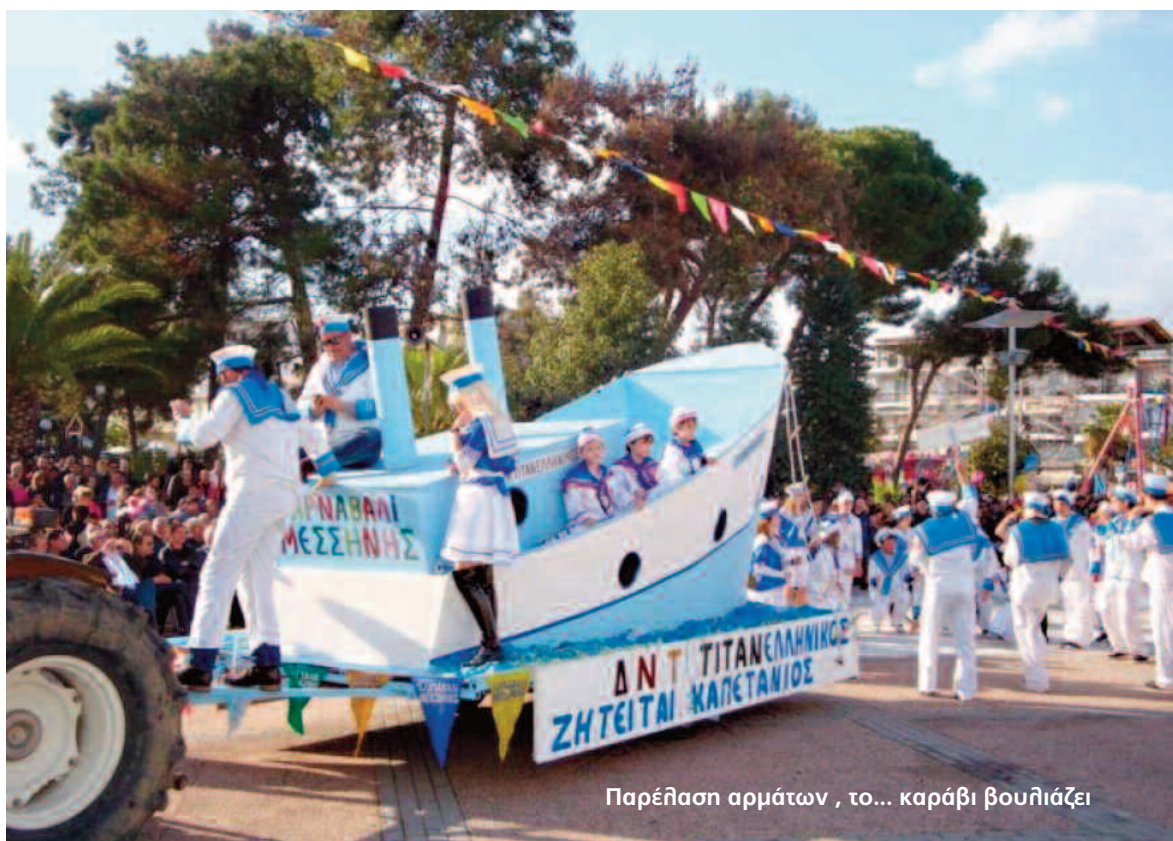
Παρέλαση αρμάτων , το... καράβι βουλιάζει

Σύμφωνα με το πρόγραμμα, σήμερα το πρωί αρχίζει το "Παιχνίδι του κρυμμένου θησαυρού" σε χώρους της Μεσσήνης και ολοκληρώνεται αύριο στο αμφιθέατρο του πάρκου της πόλης. Το παιχνίδι τα τελευταία χρόνια διοργανώνεται από το Ράδιο Μεσσήνη με μεγάλη επιτυχία, όπως αποδεικνύει η συμμετοχή των παιδιών. Μέχρι χθες το απόγευμα είχαν δηλώσει συμμετοχή 5 ομάδες.