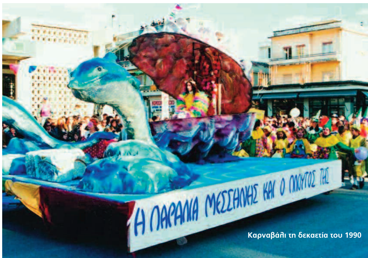
Καρναβάλι τη δεκαετία του 1990