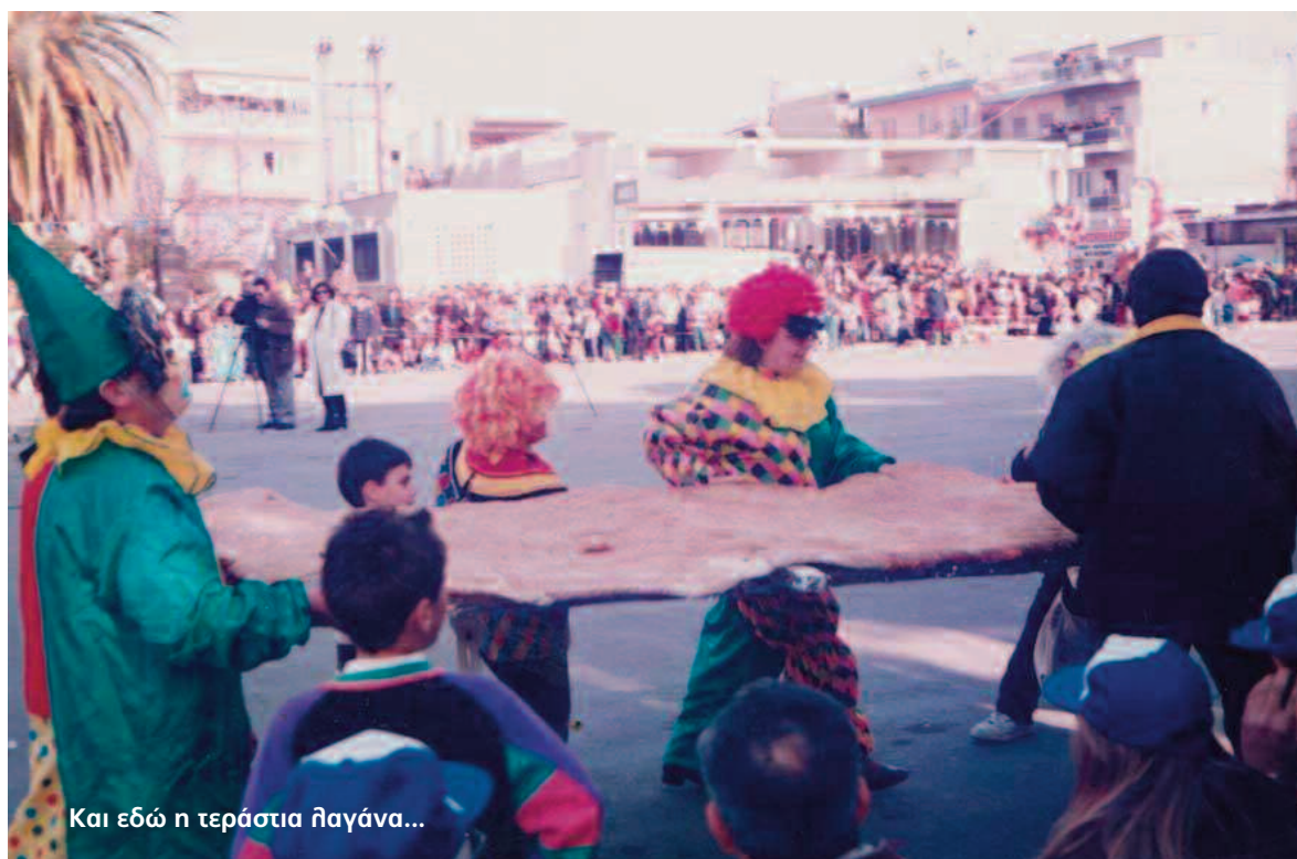
Και εδώ η τεράστια πλαγίνα...

σμένων καρναβαλιστών. Στις 9.30 το βράδυ προγραμματίζεται η αναβίωση της χορωδίας της Μαντολινάτας από το Σωματείο Εθελοντών Μεσσήνης και το διευθυντή του Μουσικού Συλλόγου «Ιαμβος», σε κεντρικούς δρόμους της πόλης, στην κεντρική πλατεία και στις παραδοσιακές φωτιές -ενώ βεγγαλικά θα φωτίσουν το νυχτερινό ουρανό για τα 150 χρόνια του Καρναβαλιού της Μεσσήνης. Αύριο Καθαρή Δευτέρα στις 11 το πρωί θα γίνει μετάβαση τσοηιάδων στην πλατεία της Κρεμάλλας, όπου μισή ώρα αργότερα θα αναβιώσει η δίκη και ο απαγχονισμός της γριάς Συκούς από τον Ιμπραήμ πασά. Στη διάρκεια των εκδηλώσεων θα προσφέρονται κεράσματα από το Σωματείο Φορτοεκφορτωτών και παραδοσιακή φασολάδα από το Σύλλογο Γυναικών Μεσσήνης. Στις 2 το μεσημέρι θα ξεκινήσει το παιδικό καρναβάλι, με τη συμμετοχή ξυλοπόδαρων, ζογκλέρ και κλόουν. Στις 3 ξεκινά στην κεντρική πλατεία η παρέλαση της Δημοτικής Φιλαρμονικής, των μαζορετών του Συλλόγου «Οι Φίλοι της Μεσσήνης», αρμάτων και πεζοπόρων τμημάτων μεταμφιεσμένων που θα αποτελούν τη συνοδεία του βασιλιά Καρνάβαλου, ο οποίος θα εκφωνήσει τον καθιερωμένο σατιρικό λόγο του. Θα ακολουθήσει διασκέδαση και ξεφάντωμα στην κεντρική πλατεία, σε... εξωτικούς ρυθμούς. Οι αποκριάτικες εκδηλώσεις του Δήμου Μεσσήνης θα ολοκληρωθούν στις 7 το βράδυ, με αποκριάτικο πάρτι στην αίθουσα δεξιώσεων «Νεφέλη» του Μιχ. Τσέλιου, που διοργανώνει το Πνευματικό Κέντρο Μεσσήνης για όσους θα συμμετάσχουν στις καρναβαλικές εκδηλώσεις.