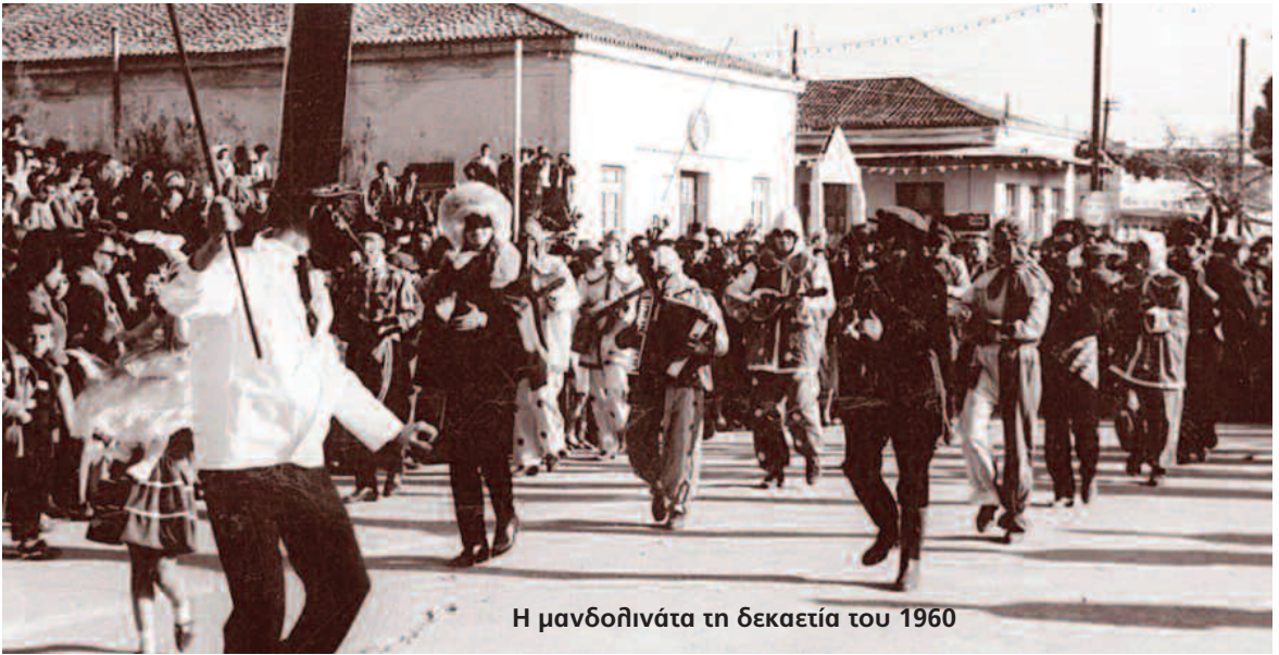
Η μανδολινάτα τη δεκαετία του 1960

της Μεσσήνης που διαρκούν μέχρι της πρωίας της Καθαρής Τρίτης για να μείνι αξέχαστη η γιορτή σ' όσους θα έχουν την τύχη να την χαρούν.