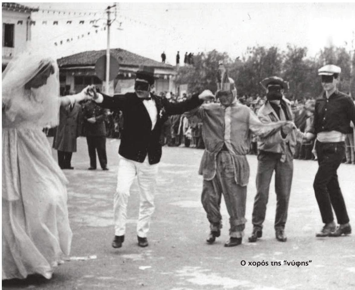
Ο χορός της "νύφης"

ζόντιου δοκαριού μια τροχαλία από την οποία περνά ένα σχοινί, που η μια του άκρη καταλήγει σε θηλιά, ενώ την άλλη την κρατούν μερικοί εύθυμοι "δήμιοι". Οσους περνούν από εκεί τους "συλλημβάνουν" - γυρεύοντας βέβαια πάνε και τα υποψήφια θύματα - και δεν τους κατεβάζουν αν προηγουμένως οι "κρεμασμένοι" δεν τάξουν ένα γερό κέρασμα".