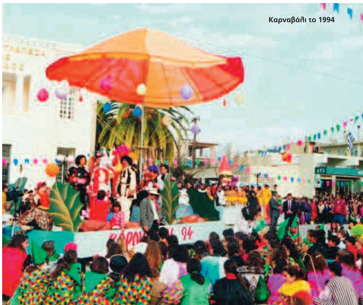
Καρναβάλι το 1994

σμένοι και μη θα χορέψουν, θα πιουν πολύ κρασί και θα διασκεδάσουν μέχρι το πρωί.