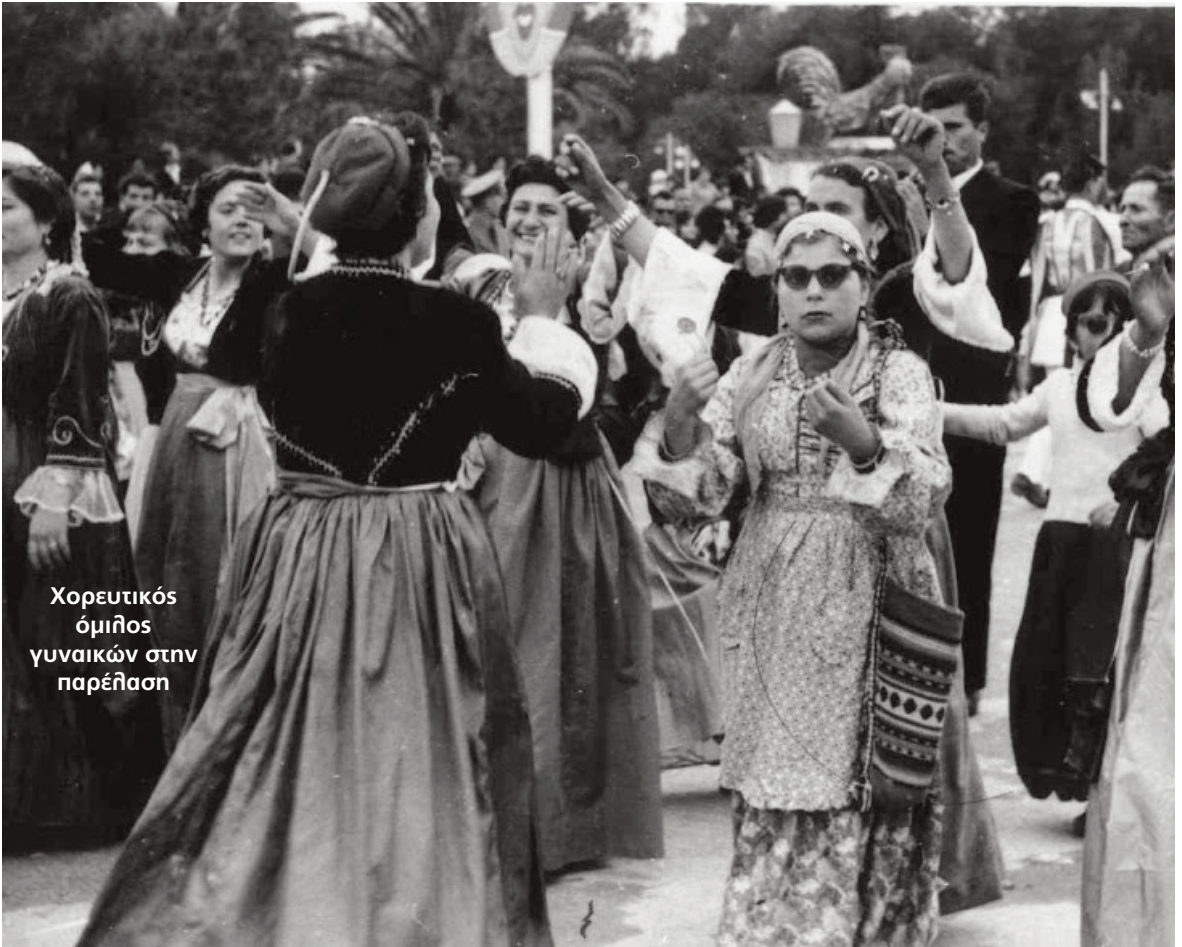
Χορευτικός όμιλος γυναικών στην παρέλαση

Ωρα 8 μ.μ.: Γλέντι μέχρι το πρωί στα κέντρα της πόλεως.