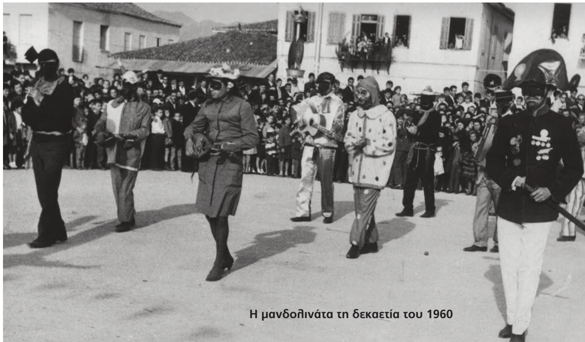
Η μαντολινάτα τη δεκαετία του 1960