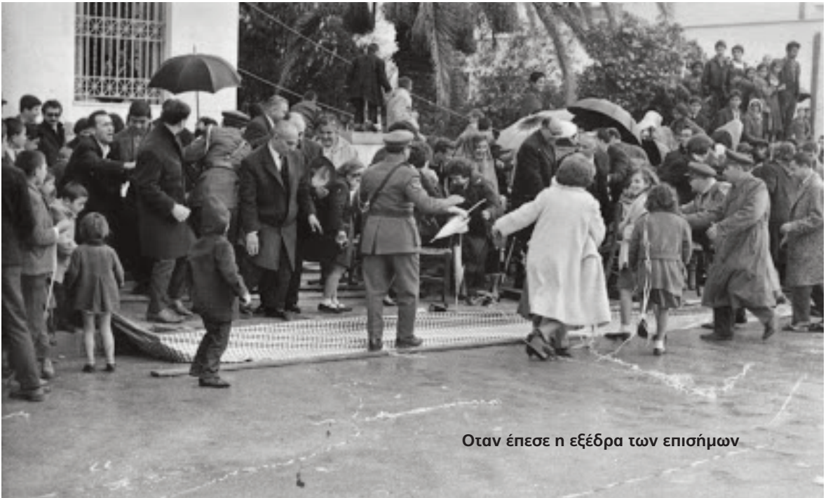
Όταν έπεσε η εξέδρα των επισήμων