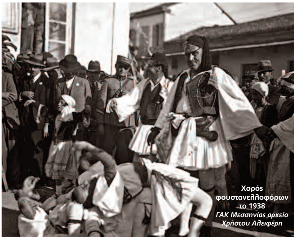
Χορός φουστανελλοφόρων το 1938 ΓΑΚ Μεσσηνίας αρχείο Χρήστου Αλειφέρη

Λίγες ημέρες πριν από την Καθαρά Δευτέρα το 1940, οργανώνεται "μεγάλη χοροεσπερίς εις Μεσσήνην υπέρ των μαθητικών συσσιτίων" (142) : «Μεσσήνη (Του ανταποκριτού μας) - Μέσα σε μια ατμόσφαιρα ευθυμίας και κεφιού, μέσα σ' ένα εκλεκτόν περιβάλλον, μέσα τέλος σ' ένα ωραιότατον σύνολον που το πλαισίωσαν ο πλούσιος στολισμός της αιθούσης, αι ωραιότεραι εμφανίσεις, τα άφθονα κοτιγιόν, η γλυκειά μουσική, το εκλεκτόν και πλούσιον κυλικείον και τόσα άλλα, έγινε το περασμένο Σάββατο ο προαγγελθείς χορός αι εισπράξεις του οποίου διετέθησαν εξ ολοκλήρου υπέρ των εν Μεσσήνη μαθητικών συσσιτίων.