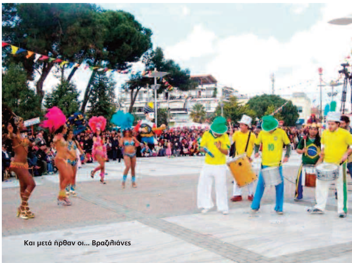
Και μετά ήρθαν οι... Βραζιλιάνες

Το 2001 γίνεται ένα ακόμη βήμα στην αλληλοίωση των παραδοσιακών χαρακτηριστικών του Νησιώτικου καρναβαλιού, καθώς κυριαρχούν η σάμπα και οι Βραζιλιάνες (421) : "Με τοιμηρή σάτιρα και πολύ κέφι σε ρυθμούς σάμπα έκλεισαν την Καθαρά Δευτέρα το απόγευμα οι καρναβαλικές εκδηλώσεις στη Μεσσήνη.