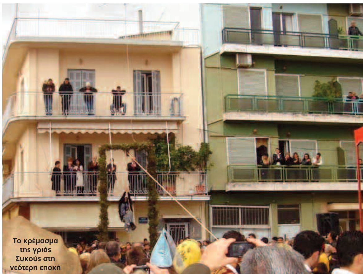
Το κρέμασμα της γριάς Συκούς στη νεότερη εποχή

Ιχνηλατώντας την πορεία του εθίμου δεν βρίσκουμε τη σύνδεση με το κρέμασμα της γριάς Συκούς παρά μόνο το 1937, την πρώτη χρονιά της δικτατορίας του Μεταξά, που είχε δώσει ιδιαίτερο βάρος στα θεάματα και την ταύτιση με "εθνικές παραδόσεις" (17) . Ενδιαμέσως δεν υπάρχει καμία αναφορά στην προέλευση του εθίμου, του οποίου προβάλλεται η εύθυμη πλευρά με διάφορους χαρακτηρισμούς όπως θα διαπιστώσουμε στη συνέχεια. Δυστυχώς οι εφημερίδες δεν κατέγραψαν μια απόπειρα ερμηνείας του εθίμου, καθώς το 1928 στο πρόγραμμα γιορτασμού είχε εξαγγελθεί ότι "περί ώραν 2 μ.μ. θέλει εκφωνηθεί λόγος περί υπάρξεως της κρεμάλλας" (18) . Τις επόμενες ημέρες όμως δεν γράφτηκε τίποτε και έτσι χάθηκε ένας πολύτιμος κρίκος στην αναζήτηση.