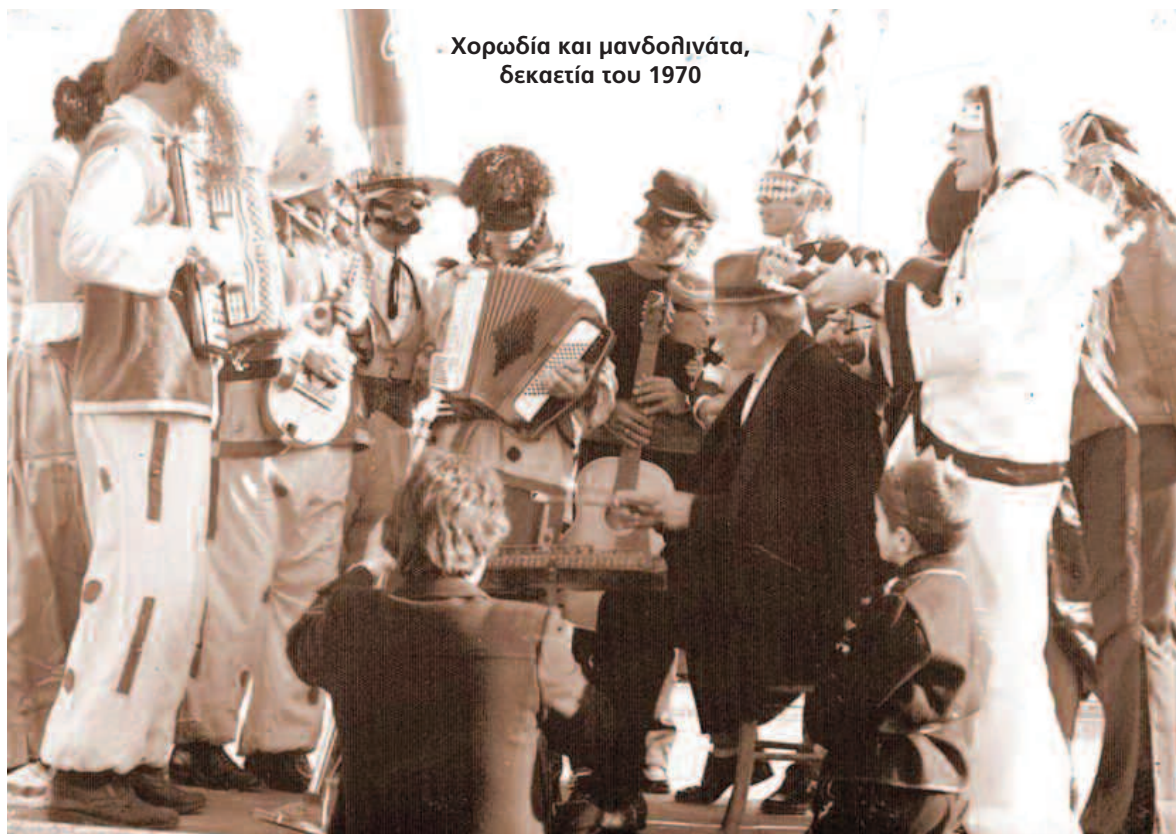
Χορωδία και μανδολινάτα, δεκαετία του 1970

την επιτυχή έμπνευσι να επισκεφθούν την Μεσσήνη.