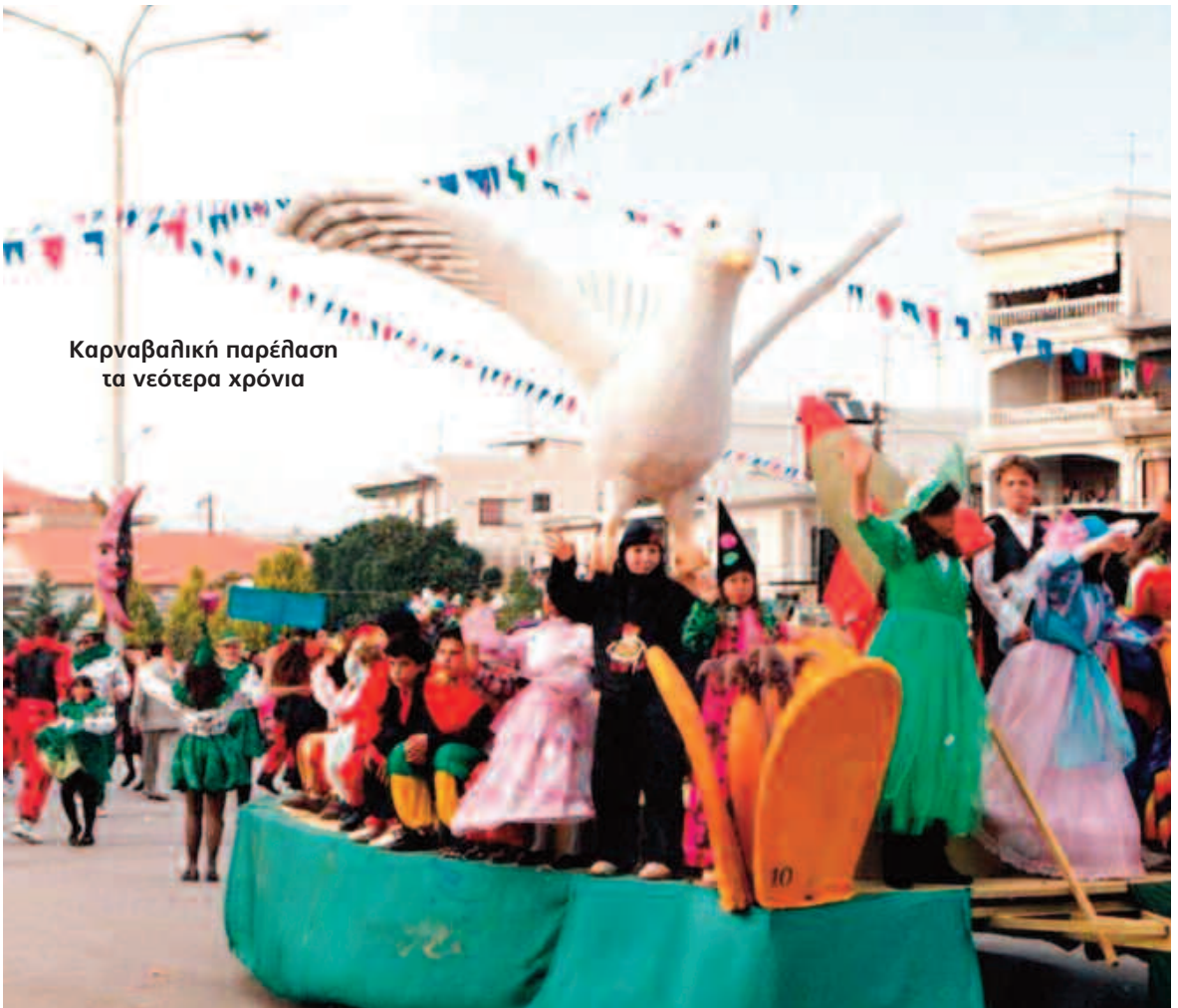
Καρναβαλική παρέλαση τα νεότερα χρόνια

είχε ο Πολιτιστικός Σύλλογος των Απανταχού Ευρισκομένων Τριοδιτών.