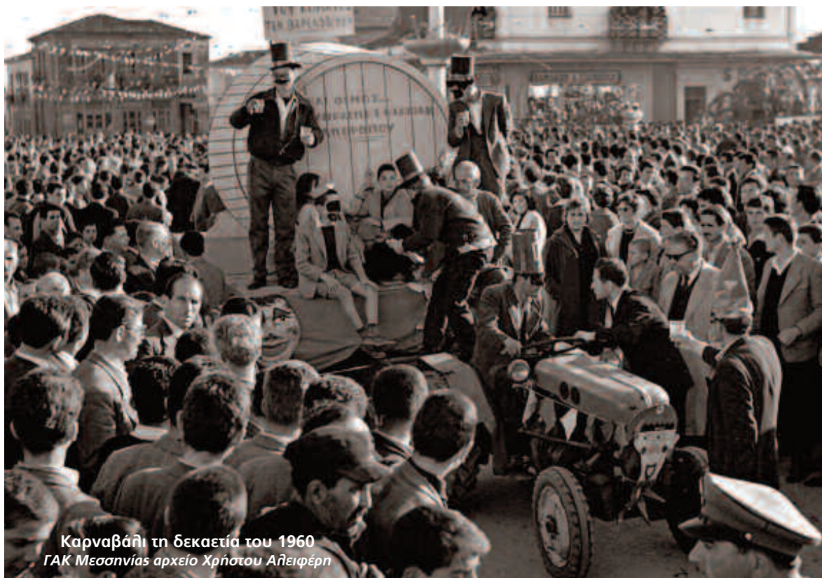
Καρναβάλι τη δεκαετία του 1960