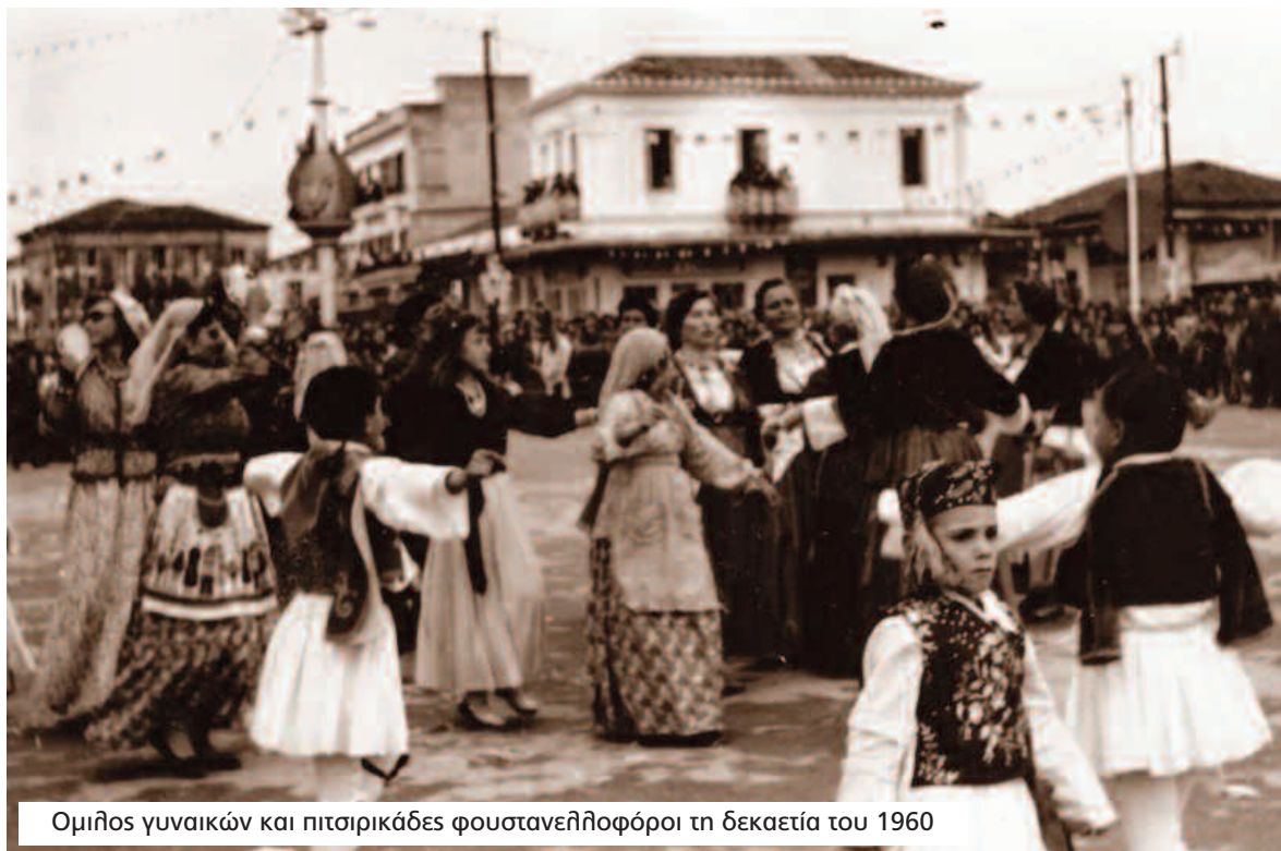
Ομίλος γυναικών και πιτσιρικάδες φουστανελληφοροί τη δεκαετία του 1960

Για το 1933 έχουμε πληροφορίες με την αναγγελία των εκδηλώσεων στις οποίες συνεργάζονται η Κοινότητα με την Ομοσπονδία Επαγγελματιών. Όπως φαίνεται οι καρναβαλικές εκδηλώσεις έχουν όλα τα στοιχεία των τελευταίων ετών (108) : «Και εφέτος όπως πάντοτε θα εορτασθή μεγαλοπρεπώς η Καθαρά Δευτέρα εν Μεσσήνη συνεργούντων προς τούτο της Κοινότητος και της Ομοσπονδίας Επαγγελματιών. Η ιστορική κρεμάλα θα κάμψι το χρέος της και θα απονεμηθώσιν υπό της επιτροπής διάφορα βραβεία εις τον πιο επιτυχημένον όμιλον φουστανελληφορών, ντομινοφόρων και την καλλυτέραν μασκαράταν, συμβολίζουσιν κάτι εκ της συγχρόνου εποχής. Η Οργανωτική Επιτροπή».