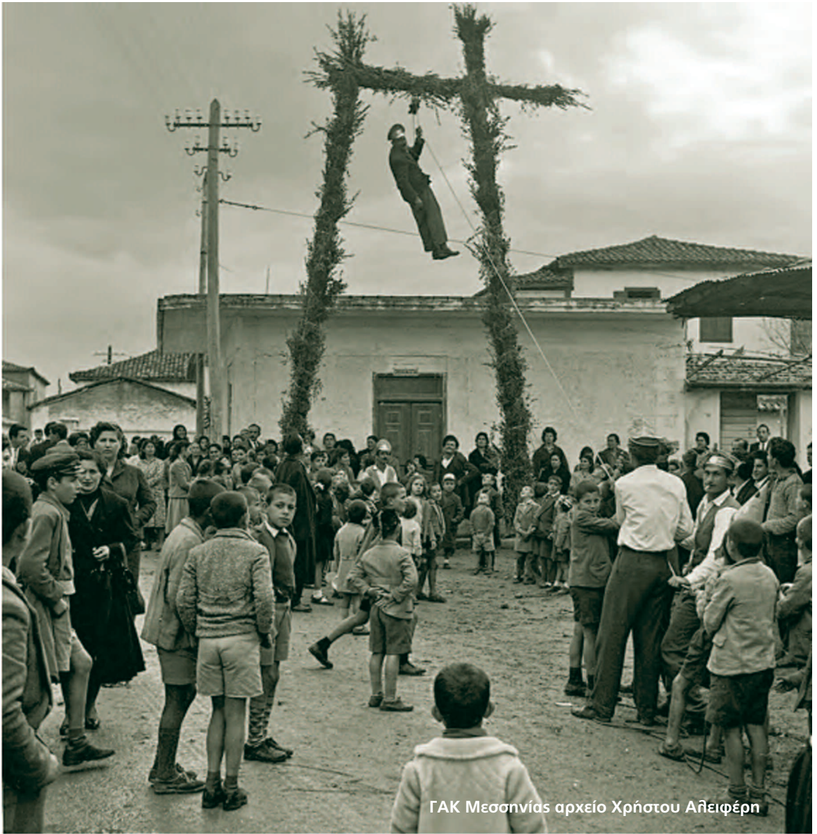
ΓΑΚ Μεσσηνίας αρχείο Χρήστου Αλειφέρνη

σχολή” δηλαδή στο χώρο που υπάρχει στις μέρες μας το κτήριο της Τράπεζας Πειραιώς. Στη συνέχεια έκανε σπίτι την εκκλησία του Αγίου Δημητρίου όπου είδε και το όνειρο δύο ημέρες πριν τη Ναυμαχία του Ναβαρίνου: “Ο Ιμπραήμ διαμένων εν Μεσσήνη εξύπνησεν έντρομος συνεπεία εκ του εξής ενυπνίου. Είδεν, ως η παράδοσις διέσωσεν, ότι εν τίνι ευρυτάτω ποταμώ ευρεθείς, ηλίευε μόνος· καθ’ ην δε στιγμήν ην έτοιμος το τρίτον ήδη να κτυπήση διά της κάμακος ωραίων τινά ιχθύν, εφορμήσαντες τρεις εκ της αντιπέραν όχθης υπερμεγέθεις κροκόδειλοι την μεν λέμβον εφ’ ης επέβαινε κατεβύθισαν, εκείνον δε δεν έφαγον, αλλ’ εσφενδόνησαν μετά της συντριφθείσης κάμακός του επί της όχθης κακώς. Σφόδρα δεισιδαίμων εταράχθη πολύ εκ του ονείρου. Η αυγή δε ήτο εισέτι προχωρημένη και η γρηνά Συκού, αθηθής Σίβυλλη της Μεσσήνης ωδηγείτο ενώπιόν του.