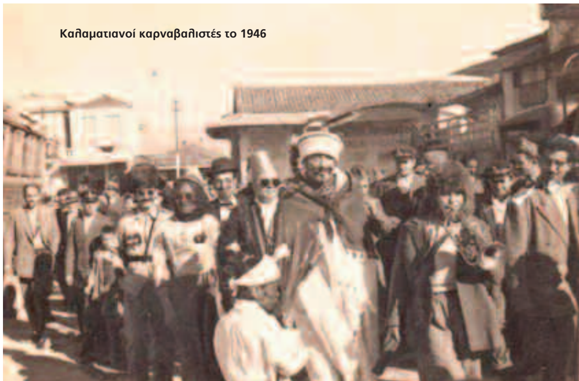
Καλαματιανοί καρναβαλιστές το 1946

Ετσι έχουν επιβληθεί περιορισμοί και στην κυκλοφορία των πολιτών, όπως φαίνεται από την ανακοίνωση που δημοσιεύεται στο "Θάρρος" (148) : «Σήμερα και αύριο, λόγω των εορτών των Απόκριων, επιτρέπεται η κυκλοφορία των πολιτών μέχρι της 2ας μεταμεσονυκτίου. Τα κέντρα διασκεδάσεως δύνανται να είναι ανοικτά μέχρι της 1.30 μεταμεσονυκτίου.