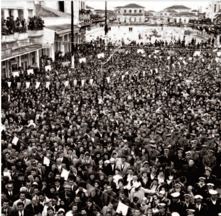
Πλήθην κόσμου παρακολουθούν το ήγιο του καρναβαλιου στις αρχές της δεκαετίας του 1960

Ωρα 15νν Πρώτη απογευματινή παρέλασις ολοκληρήρου της μασκαράτας προ της εξέδρας της επιτροπής βραβείων.