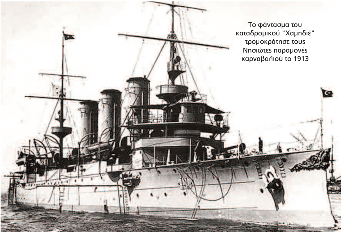
Το φάντασμα του καταδρομικού "Χαμηδιέ" τρομοκράτησε τους Νησιώτες παραμονές καρναβαλιού το 1913

Κοντά σε όλα αυτά υπάρχει μια νέα αυστηρή αστυνομική διάταξη (71) με την οποία επιχειρείται να ελεγχθεί η κατάσταση: "Εξεδόθη παρά της αστυνομικής διευθύνσεως διάταξις, διά της οποίας λαμβάνεται πρόνοια, διακανονιζομένων των μετεμφιέσεων κατά τας εορτάς των