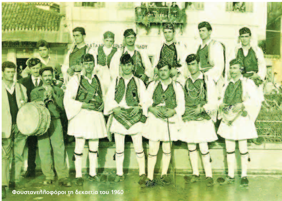
Φουστανελλοφόροι τη δεκαετία του 1960

Λίγες ημέρες πριν τις εκδηλώσεις δημοσιεύεται το πρόγραμμα (95) το οποίο δίνει ιδιαίτερη σημασία στην καύση πυροτεχνημάτων στην πλατεία η οποία θα φωτίζεται "δι' απλήτου φωτός" καθώς πριν από λίγο καιρό στο Νησί είχε εγκατασταθεί εταιρεία παραγωγής ηλε-